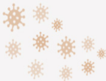
Bụi dính giọt dịch có vi rút