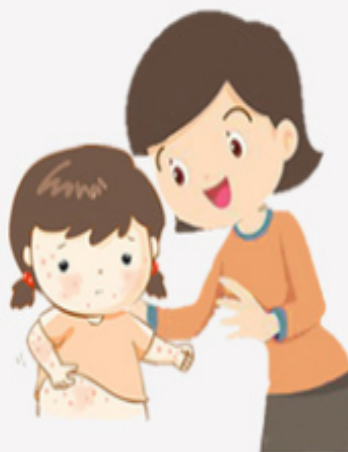
Tiếp xúc trực tiếp với người bị bệnh